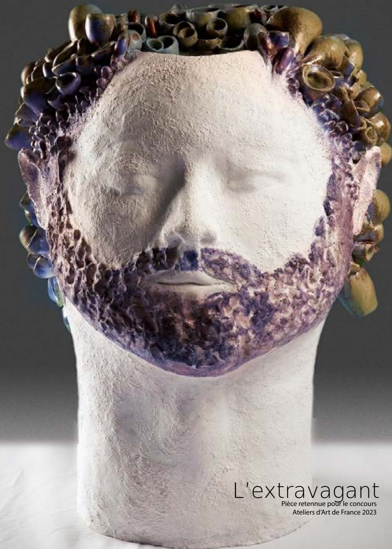
L'extravagant Pièce retenue pour le concours Ateliers d'Art de France 2023