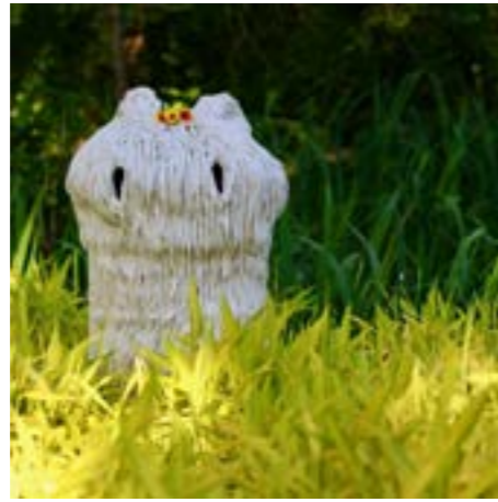
Créature majeure du printemps (2021)