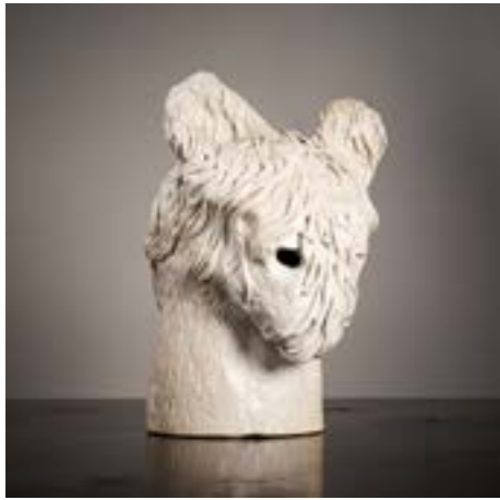
Le veilleur (2021)