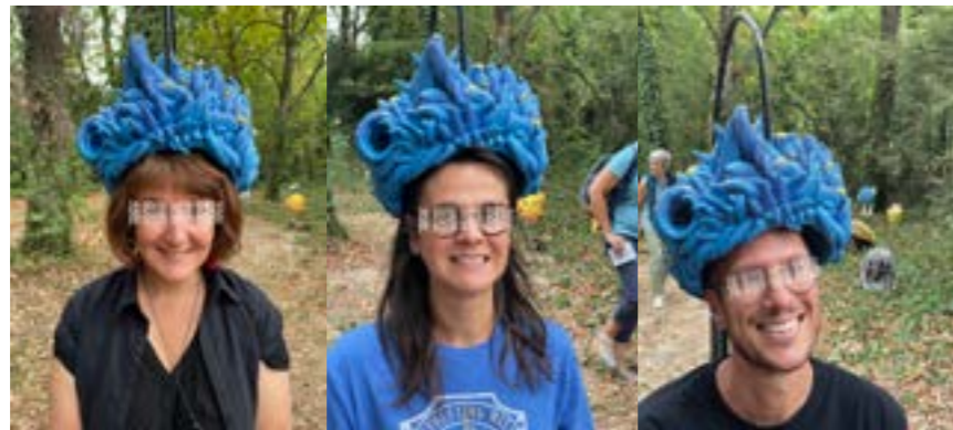
Public invité à se prendre en selfie sous une perruque de plusieurs kilos

Perruque suspendue en grès engobé Exposition «AU POIL» Campagn'art#3